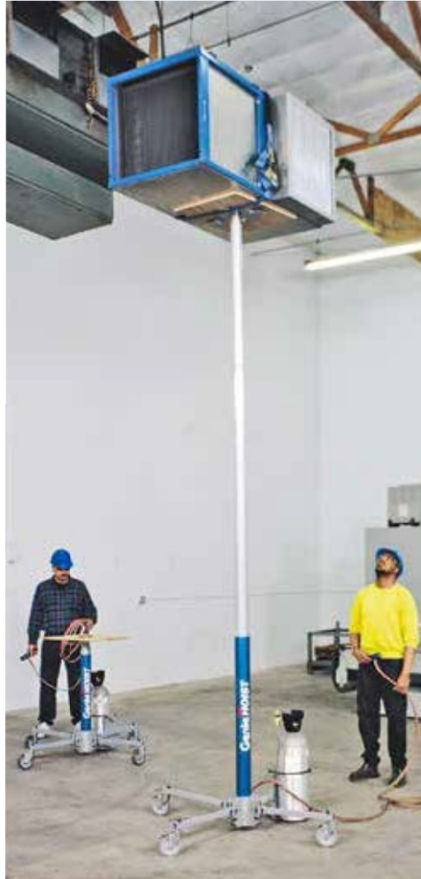
Monte-matériaux Hoist GH

Les monte-matériaux du fabricant américain Genie font partie des produits leader dans le monde de ce segment; on pourrait même dire qu'ils sont les originaux. La technique simple et bien mûrie rend la manipulation très facile et grâce à la construction robuste mais légère, les appareils ont une grande durée de vie. Ainsi, une efficacité maximum et des frais d'exploitation minimum sont garantis.