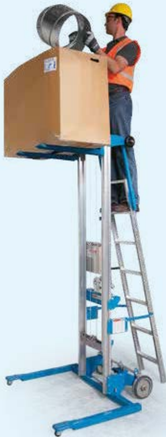
Monte-matériaux GL 4