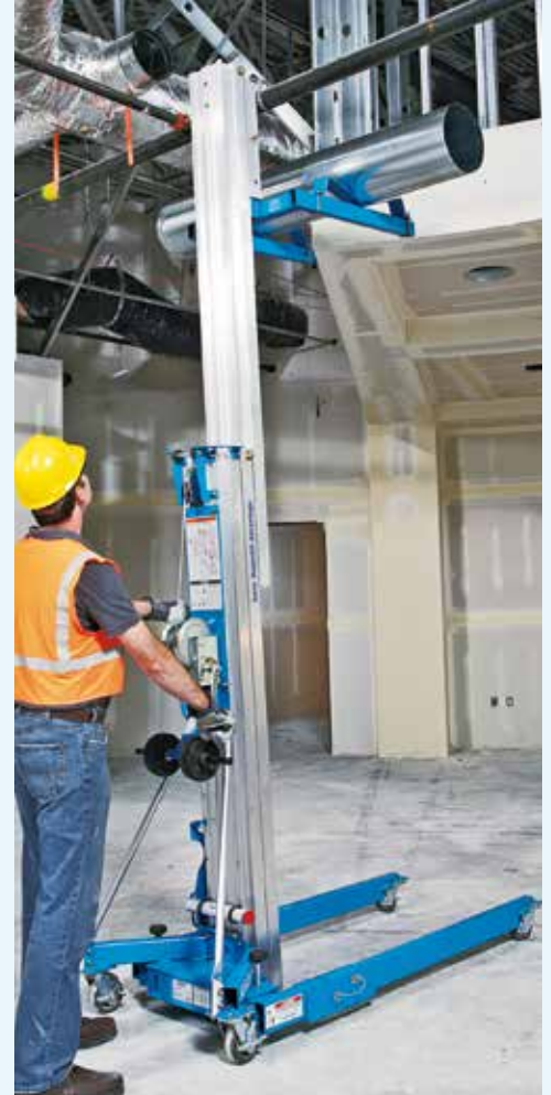
Monte-matériaux SLA 15

En plus du modèle Hoist GH fonctionnant à l'air comprimé, deux séries d'élévateurs de montage sont disponibles. On trouve la série légère GL, pour des hauteurs d'élévation maximales jusqu'à 4,2 m et une charge utile de 159 kg tandis que la série SLA est conçue pour des hauteurs d'élévation jusqu'à presque 8 mètres et une charge utile de 295 kg. Ces monte-matériaux fonctionnent avec une manivelle.